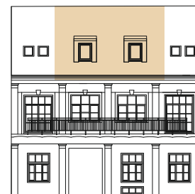
POHLAD JUŽNÝ - DVORNÝ