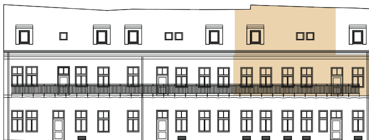
POHLAD ZÁPADNÝ - DVORNÝ