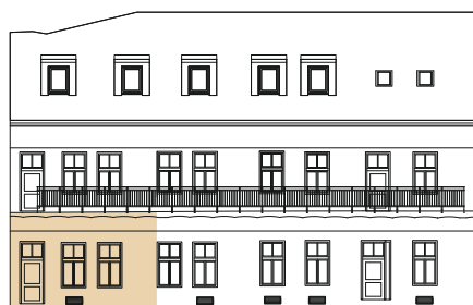
POHLAD SEVERNÝ - DVORNÝ