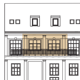
POHLAD JUŽNÝ - DVORNÝ